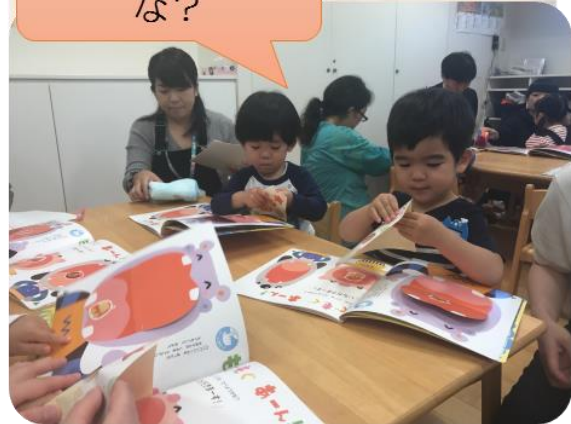
どれを貼ろうかな？