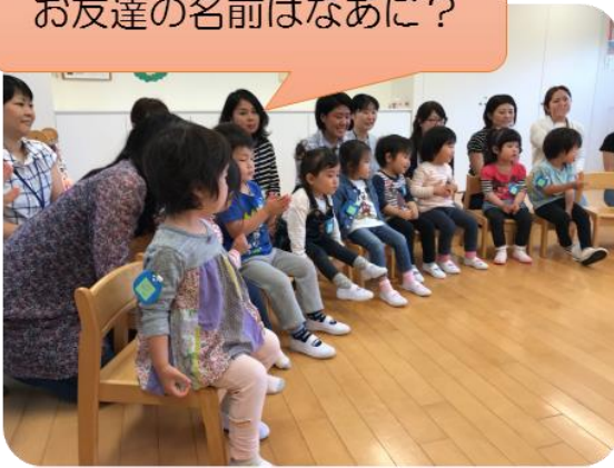
お友達の名前はなあに？