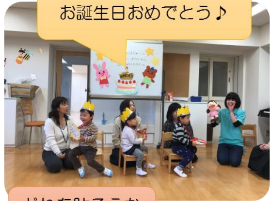
どれを貼ろうかな？